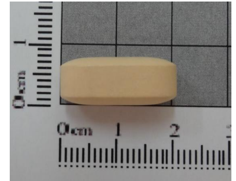
เม็ดยาด้านข้าง