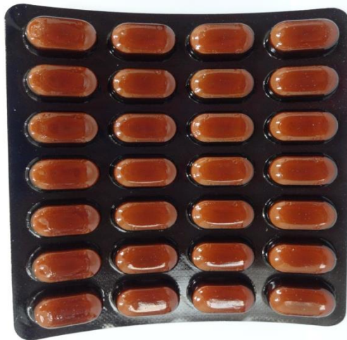
แผงเม็ดยาด้านหน้า