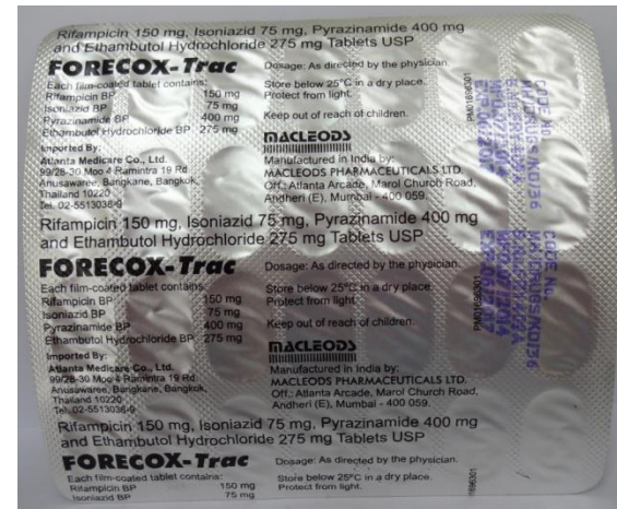
แผงเม็ดยาด้านหลัง