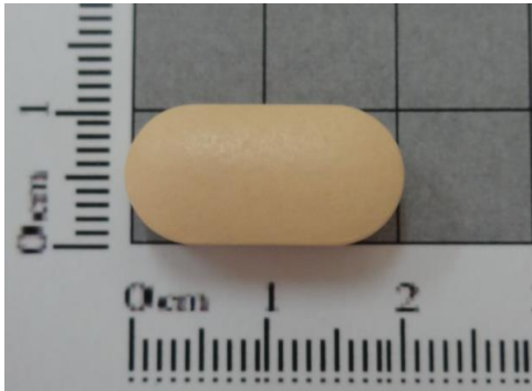
เม็ดยาด้านหน้า